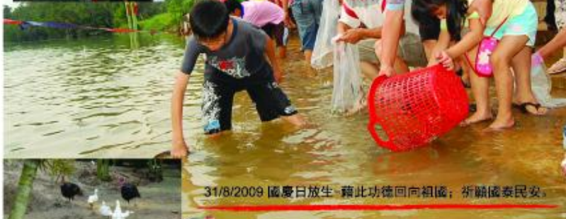
31/8/2009 國慶日放生-藉此功德回向祖國；祈願國泰民安。