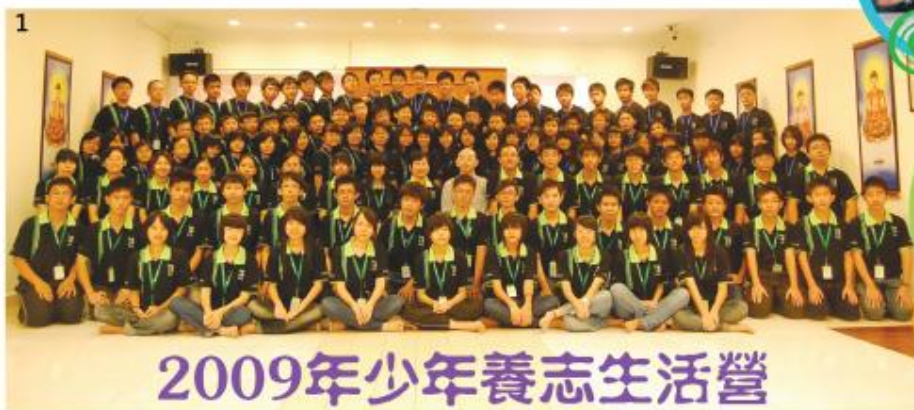
2009年少年養志生活營