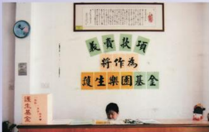
有任何疑問，歡迎到服務台來詢問。