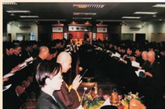
2005年8月14日中元節三時繫念超薦法會。