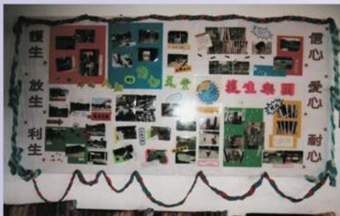
資訊中心壁報-總園縮景