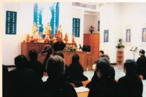
師父特為佛三同修慈悲開示。