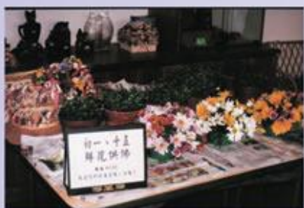
鮮花義賣-供佛又護生；一舉兩得！