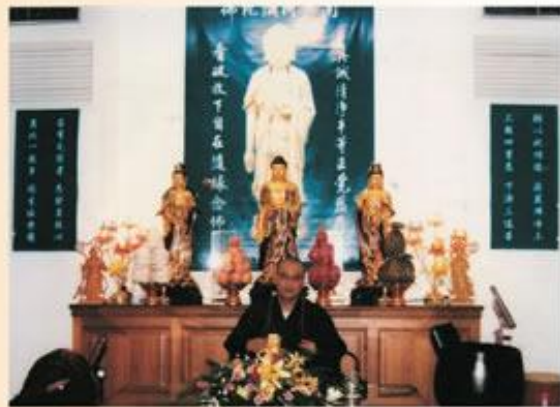
法雨遍灑，法輪常轉-此乃吾師之志也。