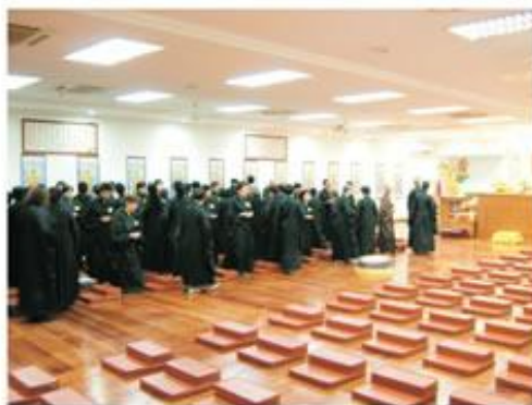
八關齋戒：一日一夜持淨戒