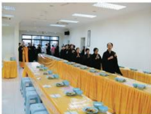
用餐也要注重威儀—過堂吃飯