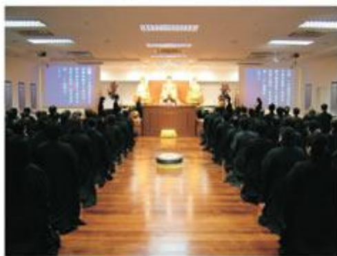
三日精進念佛，多積往生資糧。