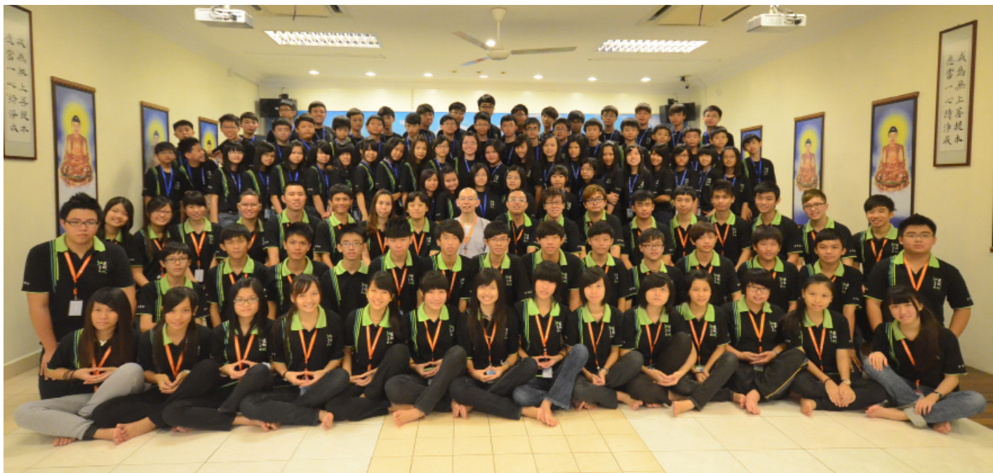
第六屆少年養志生活營全體營員大合照