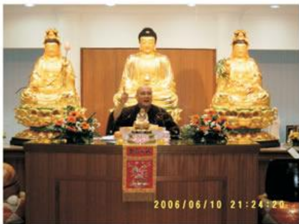
佛以一大事因緣出興於世

十、今天，千經萬論指歸到念佛法門，讓你明白何以世界一再地給我們介紹念佛法門。了解之後才知道它是實，否則天天拿著念佛經典，你也把它當作是草。