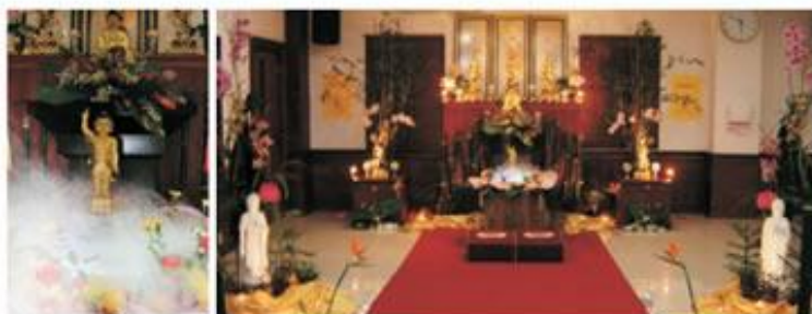
莊嚴祥和的慶典現場，恭候大眾一同來結法益