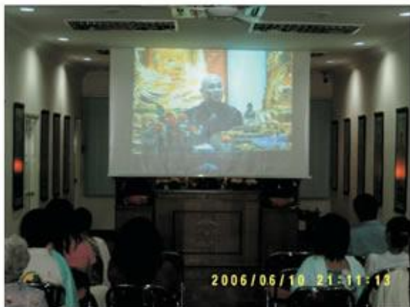
為求法故，即使在偏殿觀看影像也法喜！