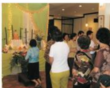
浴佛現場一隅浴佛儀式，洗滌內心的污濁——此為浴佛的含義。