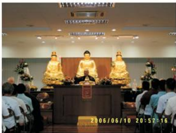
師父一再強調：千經萬論，處處指歸阿彌陀念佛法門。