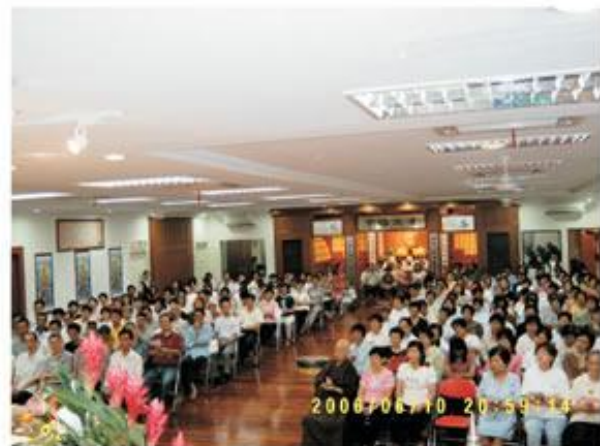
此一會，因緣殊勝，連地藏殿也坐滿人！