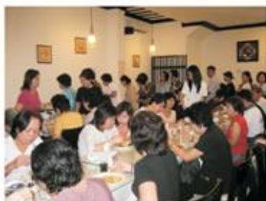
佛誕日，歡喜供眾，普願眾生皆持素!