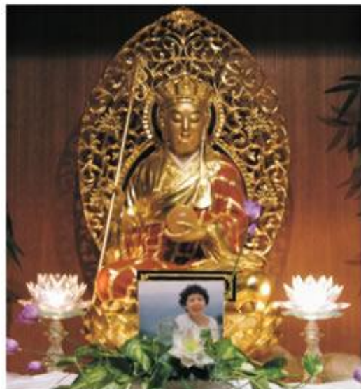
《中峰三時繫念》經法會—祈願藉此法會因緣，同向裝姐往生蓮位境界，法界衆生得以超生淨土！