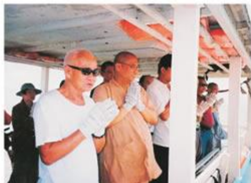
體上天好生之德，發慈悲心物我無間——裝姐往生三週年紀念日，師父率領同修前往龜咯海濱放生。

陽光奉獻給大地，露水奉獻給小草；裝姐則將晚年生命的光輝奉獻給道場。道場住持連續三年為裝姐舉辦佛三暨超薦法會，乃是感念她多年的護持，也希望後學們能延續裝姐的精神，為法為教盡一份心力！